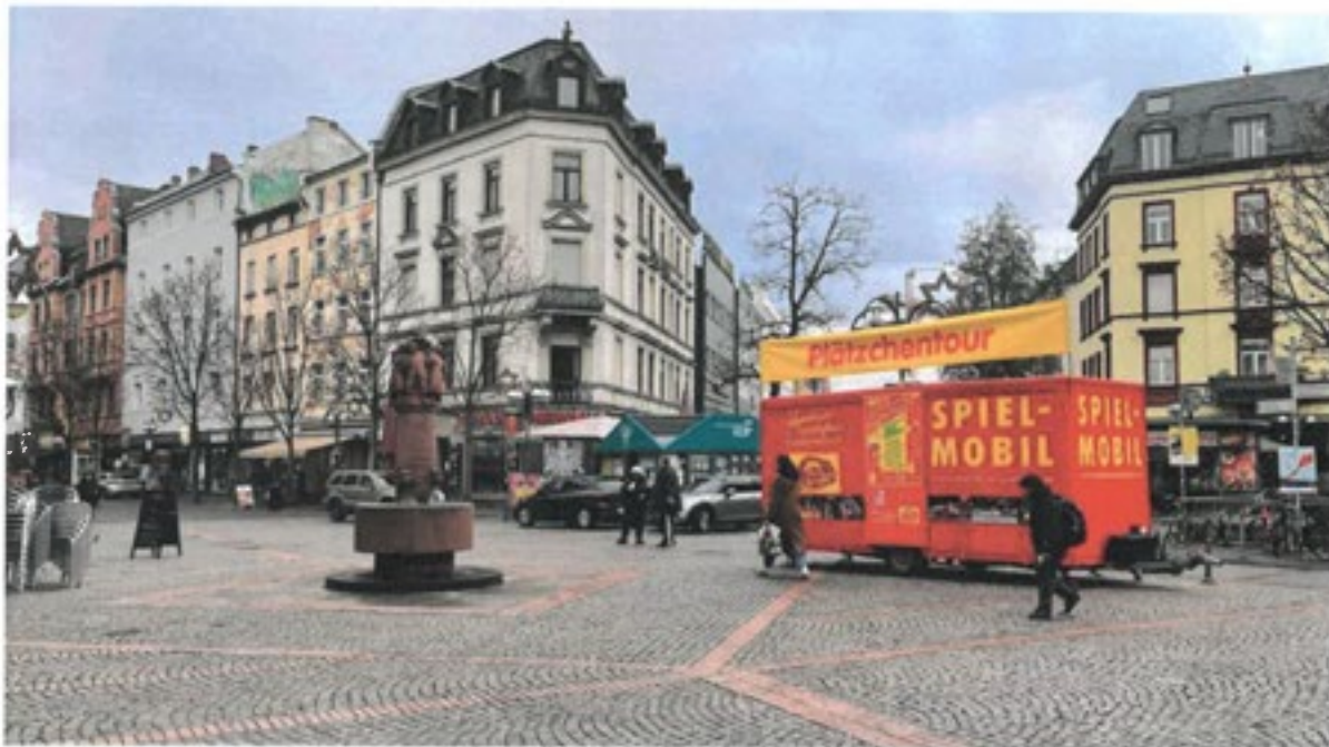
Noch bis zum 3. Dezember tourt das Spielmobil des Abenteuerspielplatz Riederwald e.V. zum Plätzchenbacken durch Frankfurt. In Bornheim durften Kinder bereits zu kleinen Bäckern werden und die Plätzchen außerdem schön verpackt mit nach Hause nehmen.