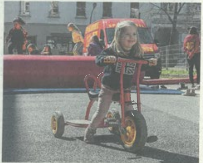
Immer mittwochs werden Spielstationen auf dem Heideplatz aufgebaut. Auch heute zum Weltspieltag.

Übrigens: Eine repräsentative Forsa-Umfrage für das Deutsche Kinderhilfswerk hat ergeben, dass die Mehrheit der erwachsenen Deutschen die Bedeutung kreativer, spielerischer und sportlicher Aktivitäten für Kinder im Kita- und Grundschulalter für wichtig hält. Also mit Kind und Kegel vorbeikommen heute. red