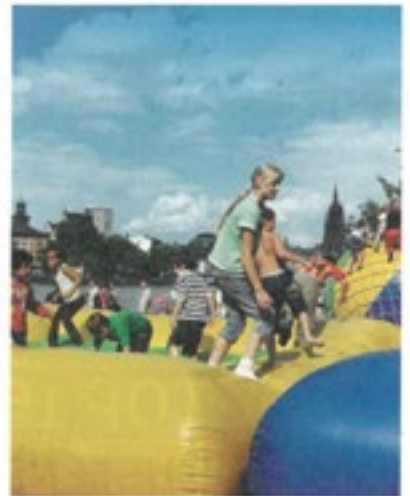
Das Mainufer wird zur Spaßpromenade.