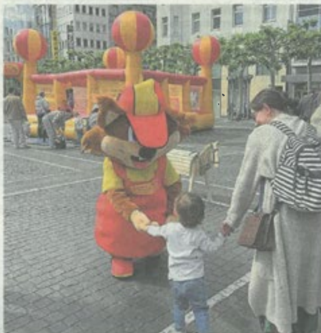
Das Maskottchen des Abenteuerspielplatzes Riederwald ist natürlich auch dabei.

Bis zum 26. September verwandelt sich die Konstablerwache deshalb jeden Freitag von