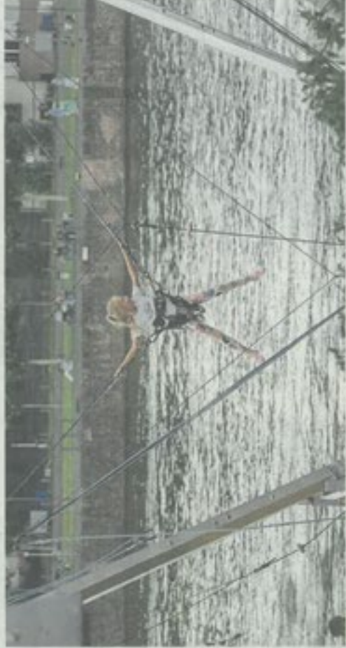
Vor allem für die Kinder war es ein großer Spaß, gut abgesichert über dem Wasser zu schweben.

Zum Programm gehörten unter anderem Hüpfungen, Bootfahren, ein Rodeogerät, Getränkekippen-Klettern mit