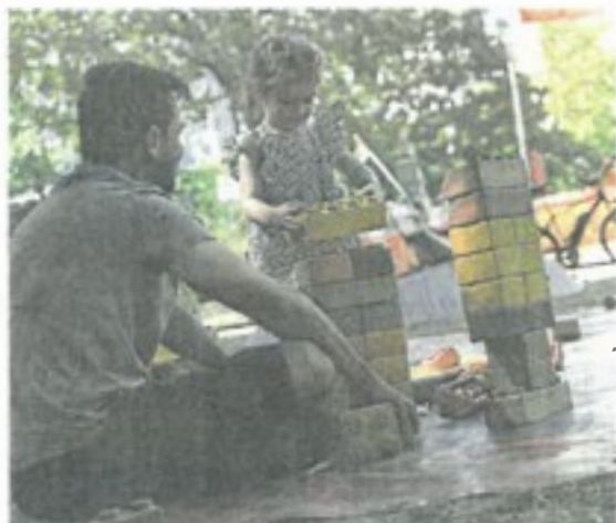
Wenn der Vater mit der Tochter Türmchen baut und ihn dann zum Einsturz bringt.