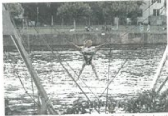
Vor allem für die Kinder war es ein großer Spaß, gut abgesichert über dem Wasser zu schweben.

Die Atmosphäre war lebendig, laut und voller Lachen. Einige Passanten blieben spontan stehen und schauten zu, wie hoch die Kinder an den Spielstationen sprangen oder kletterten. Für viele Frankfurter Familien ging am Abschlusswochenende ein fester Bestandteil der Sommerferien zu Ende. Was bleibt, ist die Vorfreude auf das nächste Jahr, wenn sich das Gelände erneut in eine große Spielfläche für Kinder verwandelt.