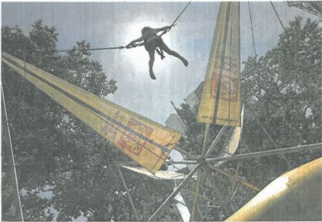
Hoch hinaus – aber gut gesichert – geht es auf dem Bungee-Trampolin.

An einem anderen Stand besprühen Kinder in bunten Farben fröhliche Motive mit Schablonen auf T-Shirts. Beim Kinderschminken verwandeln sich die Kleinen in Schmetterlinge, Piraten oder Fantasiefiguren. Aus übergroßen Lego-Steinen entstehen Türme, Wände oder kleine Festungen.