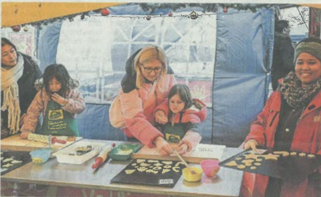
Gemeinsam backen macht Spaß.