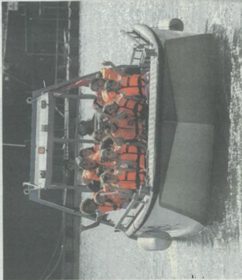
Ahoi Kameraden und Kameradinnen

Die Geschichte des Piratenboots ist lang: Als Personenfähre zwischen Frankfurt-Fechenheim und Offenbach-Bürgel begann es seine Reise und diente zwischenzeitlich als Fortschungsschiff der Senckenberg-Gesellschaft. Im Besitz des Vereins Abenteuerenspielplatz Riederwald fungierte das Boot zunächst als schwimmendes Spielmobil. 1994 rasselten dann die ersten Passagiere während der Piratenbootfahrten mit den Säbeln, seit 2009 als „Hafenpiraten“.