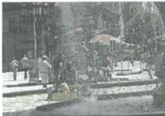
Die Brunnen sind begehrte Plätze in der Hitze.

che Motive auf T-Shirts. Beim Kinderschminken verwandeln sich die Kleinen in Schmetterlinge, Piraten oder Fantasiefiguren. Aus übergroßen Lego-Steinen entstehen Türme, Wände oder kleine Festungen.