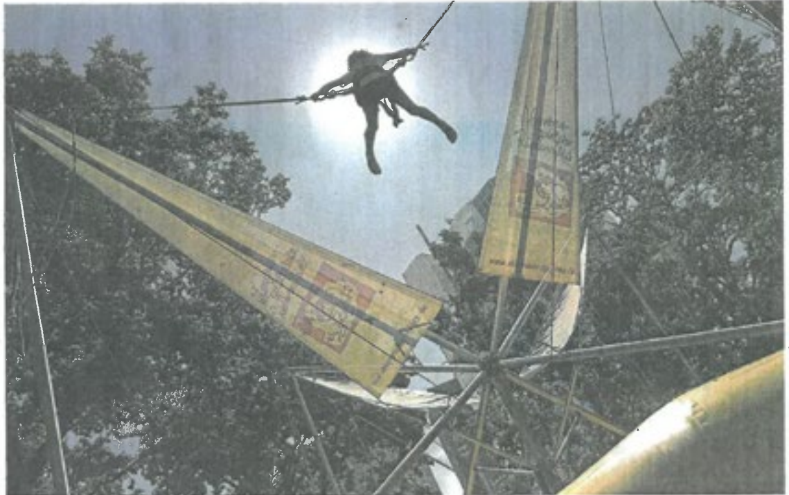
Hoch hinaus und gut gesichert mit dem Bungee-Trampolin.

An einem anderen Stand sprühen Kinder mit Schablonen und bunten Farben fröhliche