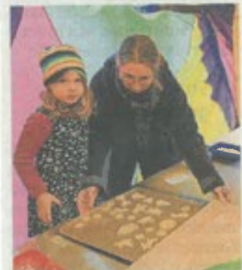
Mit dem Backblech durch die Stadtteile RAINER RÜFFER

Riedberg – Der Abenteuerspielplatz Riederwald geht wieder auf Plätzchentour. Am Montag, 17. November, 14 bis 18 Uhr, macht das Mobil auf dem Riedbergplatz Station. Damit soll den Kindern auch eine Alternative zum vermehrten Konsum von Billigwaren aus Supermärkten geboten werden, wenn sie das Angebot erhalten, mit den Betreuerinnen und Betreuern des Spielmobils gemeinsam im Rahmen dieser Adventsbäckerei Plätzchen zu backen. Von denjenigen, die die Plätzchen schön verpackt und mit Geschenkanhängern versehen mit nach Hause nehmen wollen, wird ein Teilnahmebeitrag von 5 Euro erhoben. red