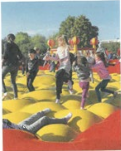
Hier werden die Kinder gefeiert.