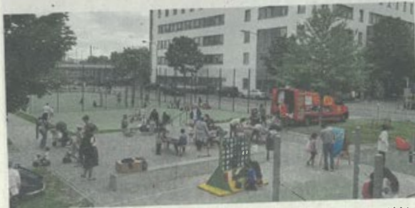
Die Spielmobil-Tour im Galluspark.