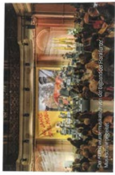
Die Abendmusikanten der Bigband der Frankfurter Musikschule