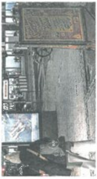
Solche Dreiecksständer sind in Frankfurt seit Sommer verboten. RAINER RÜFFER

nat rechtfertigt die Satzung. Dreiecksständer behindern die Sicht und seien damit verkehrsfähig. Außerdem habe jeder Verein die Möglichkeit, kostenfrei mit Plakaten in vielen Stellen an Straßenecken befestigt werden. Dagegen argumentieren die Sozialdemokraten. „Das Aufhängen von Hohlkammerplakaten würde Umwegen von Plastikmüll verursachen, der bei den Dreiecksständern nicht anfällt.“ Zudem seien sich die Genossen sicher, „dass der Verein immer peinlich genau daraufachtet, Ständer nur dort aufzustellen, wo weder der Verkehr behindert noch Verkehrsschilder verdeckt werden“, schreiben sie im Antrag.