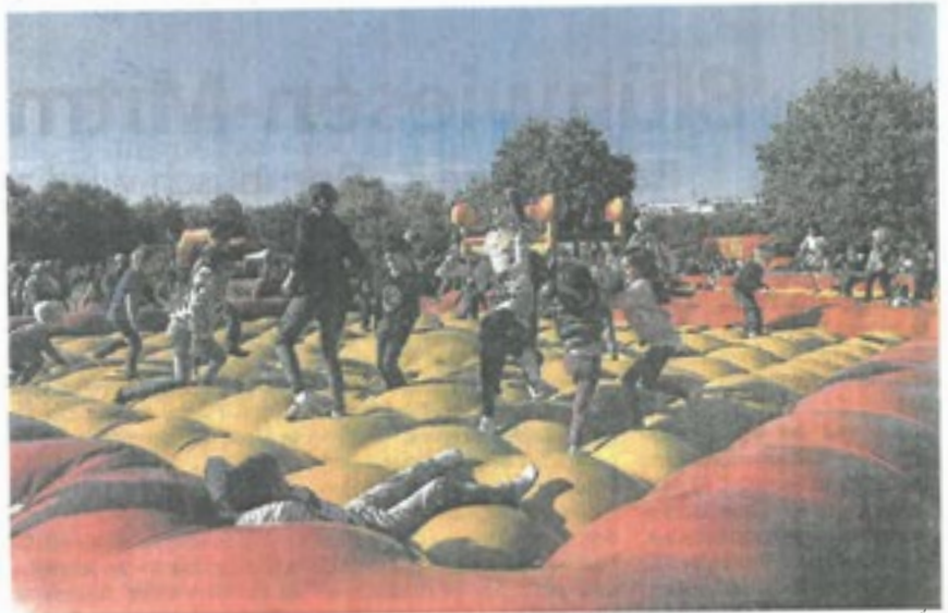
Kinder toben auf dem Hüpfkissen. Ein solches gibt es jetzt freitags an der Konstablerwache. ASP RIEDERWALD/P

Der Verein Abenteuerspielplatz Riederwald hat schon eine langjährige Erfahrung mit einem sogenannten „Stadtspielfest“ auf der Hauptwache. Diese Erfahrung soll nun einfließen in das neue Format „Beispielbare Konstablerwache“, die damit die Frankfurter Innenstadt dauerhaft noch mehr aufwerten soll.