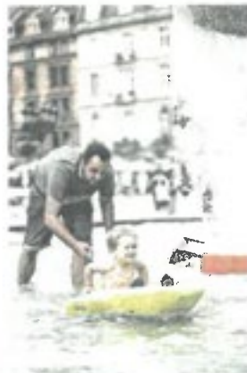
Boot fahren mit Papa im Lucae-Brunnen. M. SCHICK

Für großes Vergnügen sorgt auch das elektronisch betriebene Bullriding, auf dem man bei plötzlichem Richtungs- und Geschwindigkeitswechsel möglichst lange versucht, oben zu bleiben. Unterschiedlich große Hüpfkissen werden