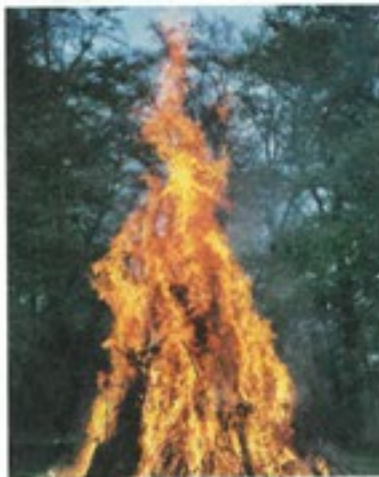
Das Feuer knistert, lodert und wärmt.

Von denjenigen, die die Plätzchen schön verpackt und mit Geschenkanhängern versehen mit nach Hause nehmen wollen, wird ein Teilnahmebeitrag von fünf Euro erhoben. Der Kostenbeitrag für einen Holzstab mit Teig zum Backen beim am gleichen Tag stattfindenden Stockbrotfeuer beträgt zwei Euro.